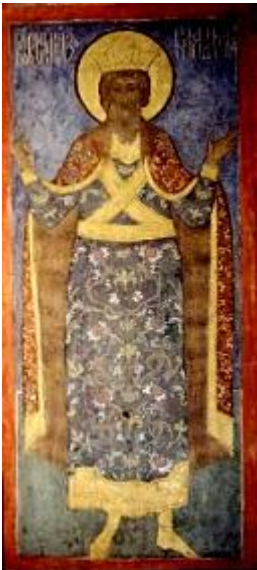
Святой Владимир. Фреска