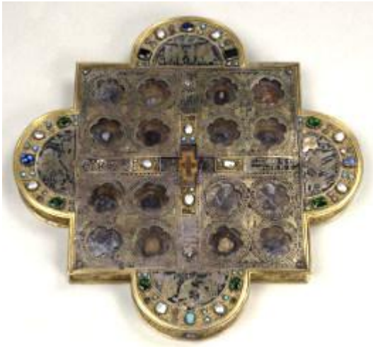
Ковчег Дионисия Суздальского, с частицей Ризы Богородицы

Почитание праздника Ризоположения издревле известно в Русской Церкви. Святой Андрей Боголюбский († 1174; память 4 июля) воздвиг во Владимире на Золотых воротах храм в честь этого праздника. В конце XIV столетия часть Ризы Богоматери была перенесена из Константинополя на Русь святителем Дионисием, архиепископом Суздальским († 1385; память 26 июня).