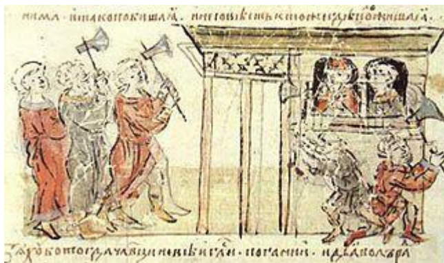
Убийство Феодора Варяга и сына его Иоанна