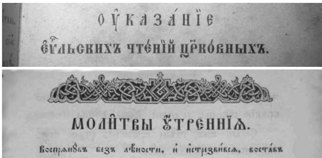
Фото 1. Фрагменты Евангелия и Часослова с текстом из прописных букв. Издания XIX в. РПЦ.

Шрифт «Panty-cl», читается (панतिकл), из семейства «Panty» предназначен для набора текста прописными буквами ЦС языка. В обычном шрифте «Panty» выносные буквы с покрытием или без него имеют больший размер, чем в «Panty cl», что необходимо для улучшения различимости при меньших размерах шрифта, но при этом выносные накладываются на заглавные буквы. В шрифте для заглавных букв «Panty-cl» размер выносных уменьшен. Заглавный «оник» имеет графему из двух заглавных компонентов «УО». Соответствующее отсутствие графемы «Оу» в шрифте препятствует использованию этой модификации шрифта для текста, набранного строчными буквами.