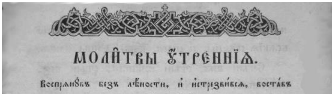
Фото 3. Фрагменты Евангелия и Часослова с текстом прописных букв. Издания РПЦ конца XIX в.