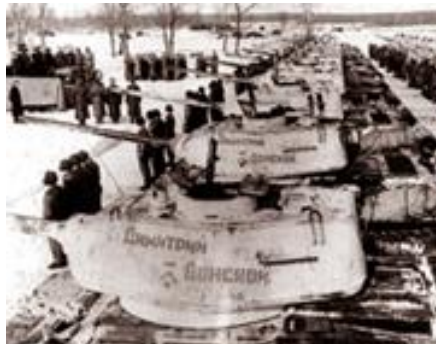
Фото – Возвращение к жизни. Врачевание в госпитале, и передача Красной Армии Православной Церковью благословения и колонны танков «Дмитрий Донской» 3

На такой Руси мы живем, подчас и не осознавая, что являемся по сути частью православной культуры, но все же живем в значительной степени по правилам этой культуры и в её порядке, преданном нам от отцов, даруемом вышней благодатью любящего нас Бога – Отца совершенного. Хотя обычно пользуемся этой культурой так же, как и в обыденной жизни – житейской логикой, в научном же её употреблении отличающейся высочайшей строгостью соответствия определённым законам. Только так возможно было обрести человеку все имеющихся ныне в обществе достижения в научно-технической, гуманитарной и социальной сферах, в добрых трудах и воинствованиях против зла.