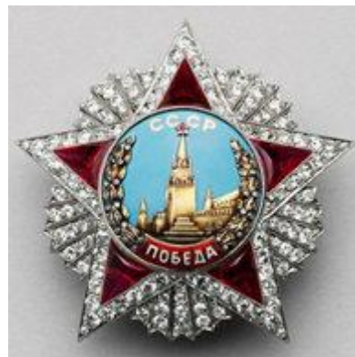
Фото – Образ Христа Спасителя на Спасской башне Кремля и «Победа» - высший военный орден времен Великой Отечественной войны 1941-1945 гг. с изображением той же башни Христа Спасителя Московского Кремля на Красной площади 4