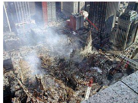
Фото – Образы современного устойчивого развития, где сотворенный Богом человек оказывается устойчивее, чем создаваемые человеком строения 1

Спасибо тем, которые, шествуя по канату, с риском для своей жизни могут продемонстрировать нам суть, истоки и последствия вот такой современной «устойчивости и стабильности развития». Но особенно большое спасибо тем, которые способны трудиться и служить, самоотверженно перенося все тяготы и лишения созидания и защиты всего доброго и крайне необходимого для нашей жизни, её процветания и крепости.