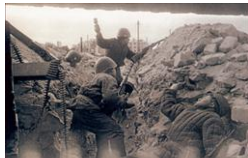
Фото – воинствующие и трудящиеся на одних полях служения Богу и Отечеству, истинному миру во Христе с ближним и между народами до краев земли 2